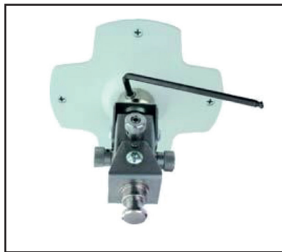
2. Setzen Sie die Kalibriervorrichtung in die Deckenplatte ein.