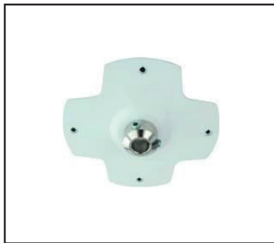
1. Positionieren und befestigen Sie die Deckenplatte sicher an der Decke.