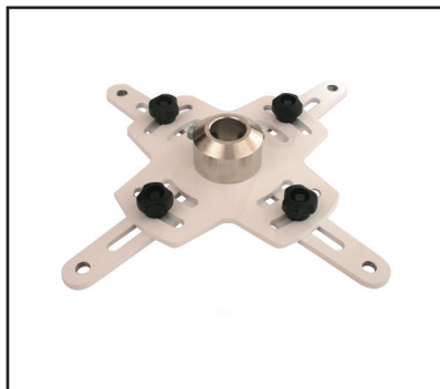
3. Positionieren Sie die Projektor-Adapterplatte mit verstellbaren Armen an der Unterseite des Projektors.