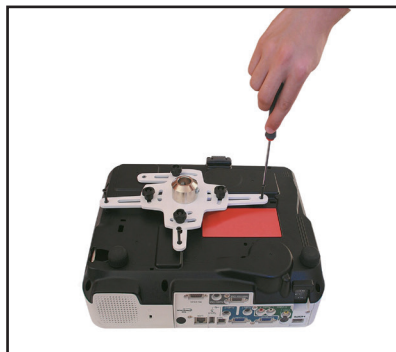
4. Befestigen Sie die verstellbare Armplatte am Projektor, indem Sie die Schrauben der Platte an den dafür vorgesehenen Bohrungen an der Unterseite des Projektors positionieren.